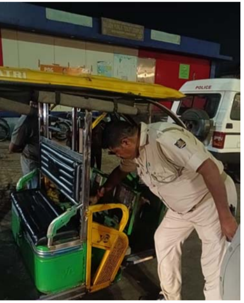
ପୋଲିସ ଷ୍ଟେସନ ୩,୦୦୦/-, ପେଟକଟା ମେରାଜନ ପୋଲିସ ଷ୍ଟେସନ ୩,୦୦୦/-, ରାମଚଣ୍ଡୀ ପୋଲିସ

ପୁରୀ : ପୁରୀ ଜିଲ୍ଲାରେ ସଡ଼କ ସୁରକ୍ଷାକୁ ଅଧିକ ସୁଦୃଢ଼ କରିବା ଓ ଯାତାଯାତ ନିୟମ ପାଳନକୁ କଡ଼ାକଡ଼ି କରିବା ପାଇଁ ପୁରୀ ପୋଲିସ ପକ୍ଷରୁ ବିଭିନ୍ନ ସ୍ଥାନରେ ନାକା ଚେକିଂ ଅଭିଯାନ ଚାଲୁ ରହିଛି । ଏହି ବ୍ୟାପକ ଅଭିଯାନ ଅନୁଷ୍ଠାନରେ ଯାତାଯାତ ନିୟମ ଉଲ୍ଲଙ୍ଘନକାରୀଙ୍କ ବିରୋଧରେ କଡ଼ା କାର୍ଯ୍ୟାନୁଷ୍ଠାନ ଗ୍ରହଣ କରାଯାଇଛି । ଏହି ଅଭିଯାନ ସମୟରେ ପୁରୀ ଜିଲ୍ଲାର ସମସ୍ତ ପୋଲିସ ଷ୍ଟେସନ ଅଂଚଳରେ ଚେକିଂ କରାଯାଇ ମୋଟ ୨,୧୭,୦୦୦/- ଟଙ୍କା ଜରିମାନା ଆଦାୟ କରାଯାଇଛି । ଗ୍ରାହକ ପୋଲିସ ଷ୍ଟେସନ ୧,୨୭,୦୦୦/-, ବାସେଲିସାହି ପୋଲିସ ଷ୍ଟେସନ ୧୦,୦୦୦/-, କୁସାରପଡ଼ା ପୋଲିସ ଷ୍ଟେସନ ୮,୫୦୦/-, ବୁଢ଼ଗିରି ପୋଲିସ ଷ୍ଟେସନ ୮,୦୦୦/-, ସିଂହହାତ ପୋଲିସ ଷ୍ଟେସନ ୭,୫୦୦/-, ତାଳବଣିଆ ପୋଲିସ ଷ୍ଟେସନ ୭,୦୦୦/-, କୋଶାଳିକା ପୋଲିସ ଷ୍ଟେସନ ୭,୦୦୦/-, ସତ୍ୟବାଦୀ ପୋଲିସ ଷ୍ଟେସନ ୭,୦୦୦/-, ସମୁଦ୍ରକୂଳ ପୋଲିସ ଷ୍ଟେସନ ୬,୦୦୦/-, ବାଲିଆପଞ୍ଚା ପୋଲିସ ଷ୍ଟେସନ ୬,୦୦୦/-, ବକଳା ପୋଲିସ ଷ୍ଟେସନ ୬,୦୦୦/-, କାକଟପୁର ପୋଲିସ ଷ୍ଟେସନ ୬,୦୦୦/-, ଚନ୍ଦ୍ରଭାଗା ମେରାଜନ ପୋଲିସ ଷ୍ଟେସନ ୫,୦୦୦/-, ଗୋପ ପୋଲିସ ଷ୍ଟେସନ ୩,୫୦୦/-, ଅଷ୍ଟରଙ୍ଗ ପୋଲିସ ଷ୍ଟେସନ ୩,୦୦୦/-, ଅରଖକୁଦା ମେରାଜନ ପୋଲିସ ଷ୍ଟେସନ ୨,୦୦୦/-, ତାରିକ୍ତ ପୋଲିସ ଷ୍ଟେସନ ୧,୫୦୦/- ଏହି ଅଭିଯାନର ମୂଳ ଉଦ୍ଦେଶ୍ୟ ହେଲା ସଡ଼କରେ ଶୁଖିଲା ବଜାୟ ରଖିବା, ଦୁର୍ଘଟଣା କମାଇବା ଓ ସାଧାରଣ ଲୋକଙ୍କୁ ଯାତାଯାତ ନିୟମ ପାଳନ ପାଇଁ ସତେତନ କରିବା । ପୁରୀ ପୋଲିସ ସଦା ସର୍ବଦା ଲୋକଙ୍କ ସୁରକ୍ଷା ପାଇଁ ପ୍ରତିବନ୍ଧ ଥରେ ଏବଂ ସହିପରି ଚେକିଂ ଅଭିଯାନ ଆଗାମୀ ଦିନରେ ମଧ୍ୟ ଜାରି ରହିବ । ପୁରୀ ପୋଲିସ ସମସ୍ତ ଯାନବାହନକୁ ଅନୁରୋଧ କରୁଛି ଯେ ହେଲମେଟ ଓ ସିଟ ବେଲ୍ଟ ପରିଧାନ କରନ୍ତୁ, ମଦ୍ୟପାନ କରି ଗାଡ଼ି ଚଳାନ୍ତୁ ନାହିଁ, ନିର୍ଦ୍ଦିଷ୍ଟ ଗତି ସାମା ପାଳନ କରନ୍ତୁ, ସମସ୍ତ ଗ୍ରାହକ ନିୟମ ମାନନ୍ତୁ । ନିୟମ ଉଲ୍ଲଙ୍ଘନ କଲେ କଡ଼ା ଆଇନନୁସ୍ଥା କାର୍ଯ୍ୟାନୁଷ୍ଠାନ ହେବା ସହିତ ଜରିମାନା ଆଦାୟ କରାଯିବ । ସାଧାରଣ ଲୋକଙ୍କ ସହଯୋଗରେ ଆମେ ଏକ ସୁରକ୍ଷିତ ଓ ଶୁଖିଳିତ ପୁରୀ ଗଠିବାର ସମ୍ଭବ ହେବ ।